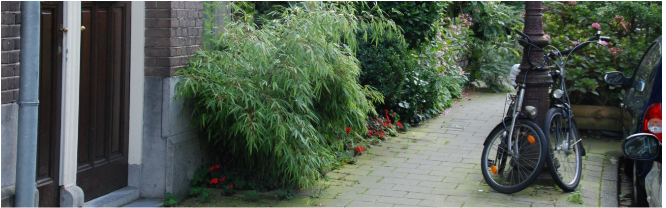
Geveltuintjes in Zuid

Door een rij tegels te verwijderen langs de gevel aan de straatkant en hier een tuintje aan te leggen, kan het van de gevel afstromende regenwater in de grond infiltreren. Daarnaast dragen geveltuinen bij aan een groener straatbeeld.