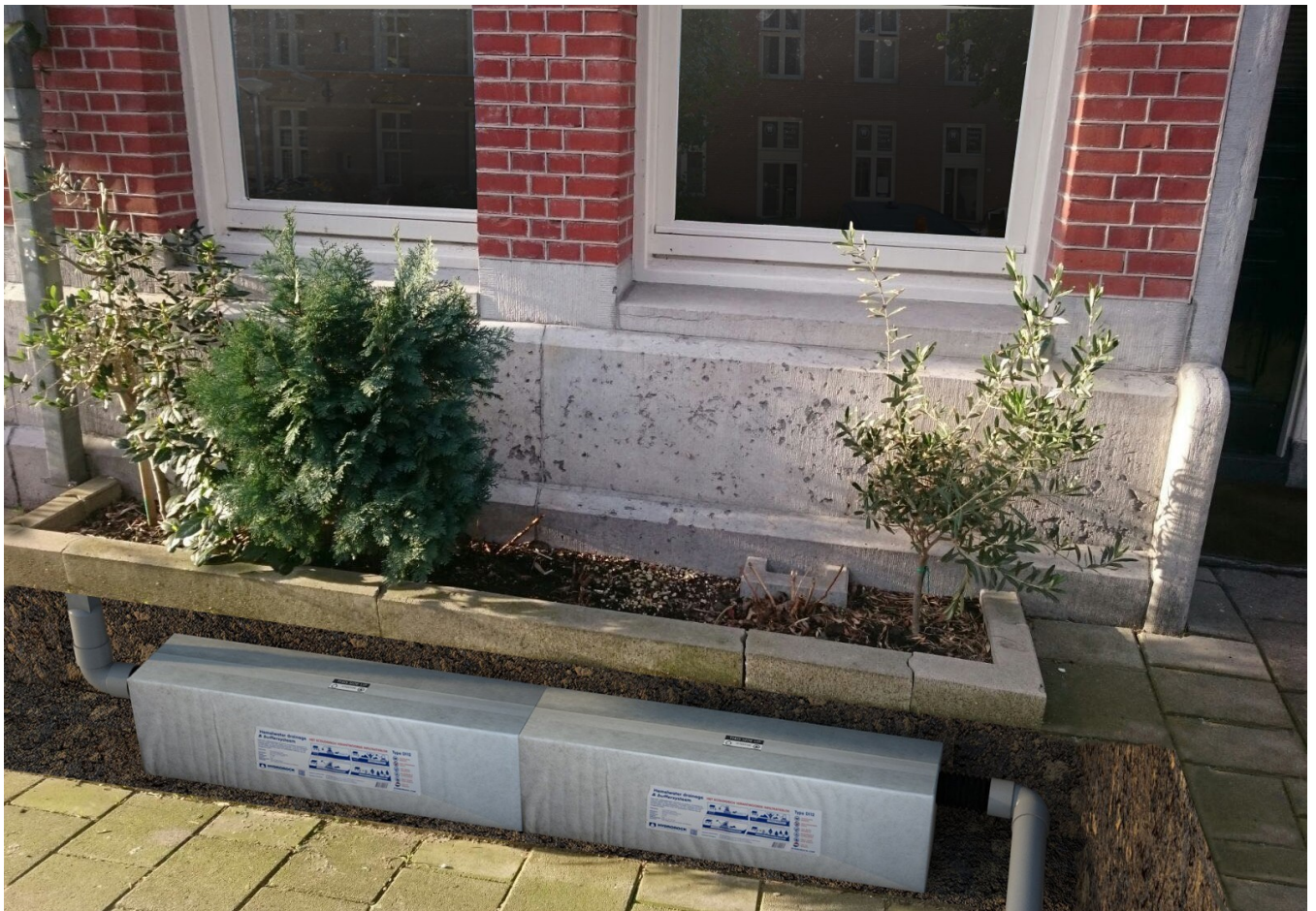
Infiltratieblokken onder een geveltuintje.