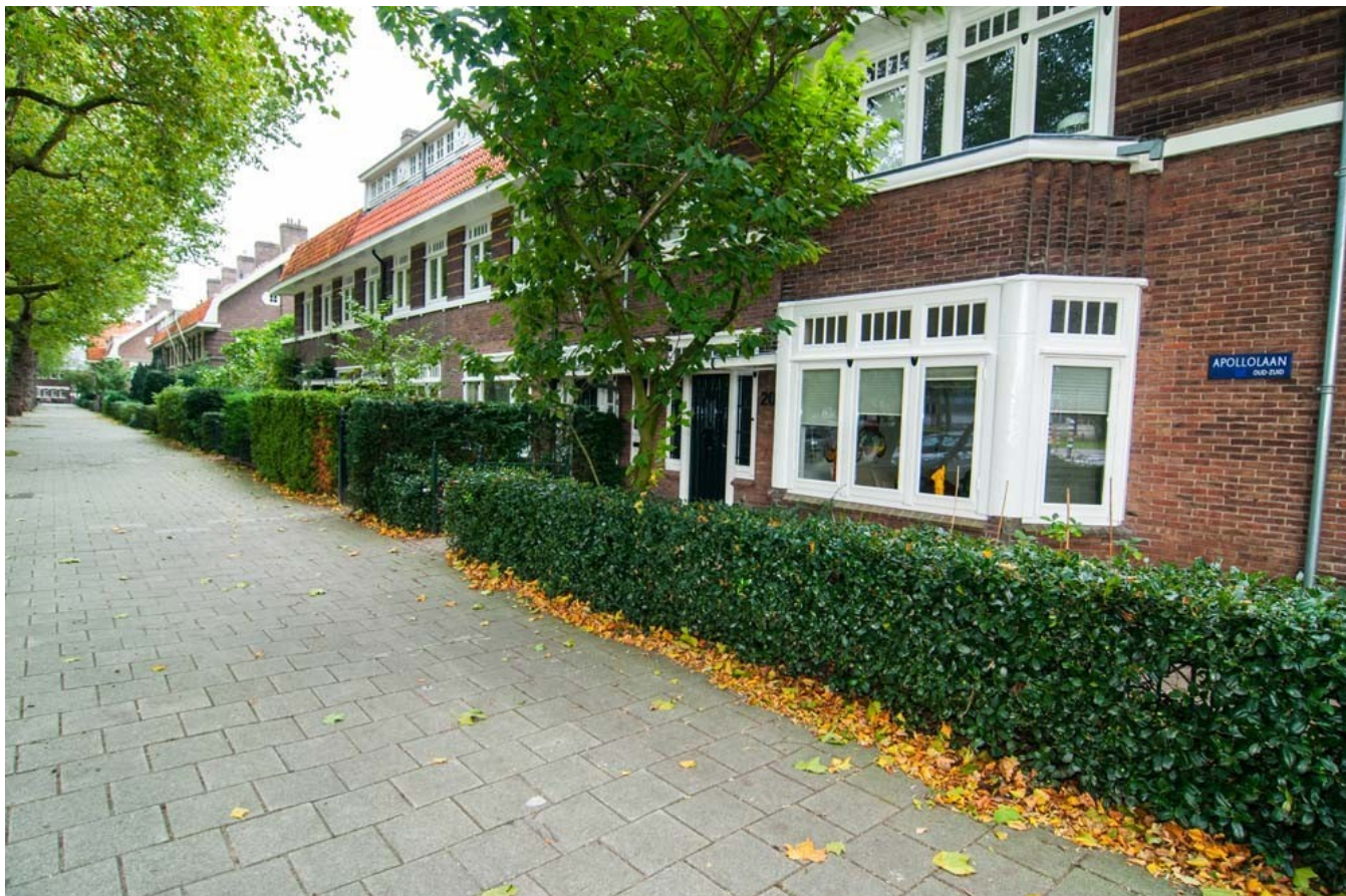
Diverse typen groene erfafscheiding

Doordat de bladeren water verdampen, dragen hagen en struiken bij aan een koelere tuin.