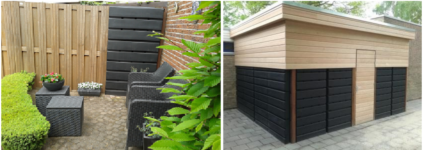
Rainwinner in de tuin en een regenwaterschuur bij een basisschool

Schematische doorsnede van een regenwaterschutting.